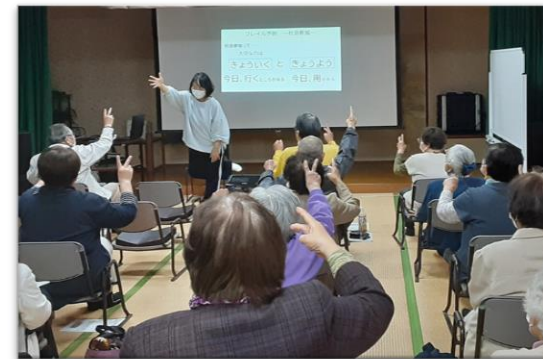
高齢者サロンなどでの介護予防普及啓発