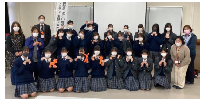
認知症サポーター養成講座