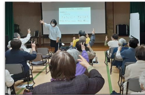
高齢者サロンなどでの介護予防普及啓発